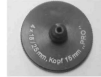
Wanit Fulgurit perçin ayarlama aracı PRO

Ahşaba sabitlemek için alt inşaat Wanit Fulgurit cephe vidaları 5,5 x 35/45 - K16 ve yenleri alınmalıdır. Deliğin çapı 7,0 mm olmalıdır.